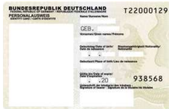
Personalausweis des Heimatlandes