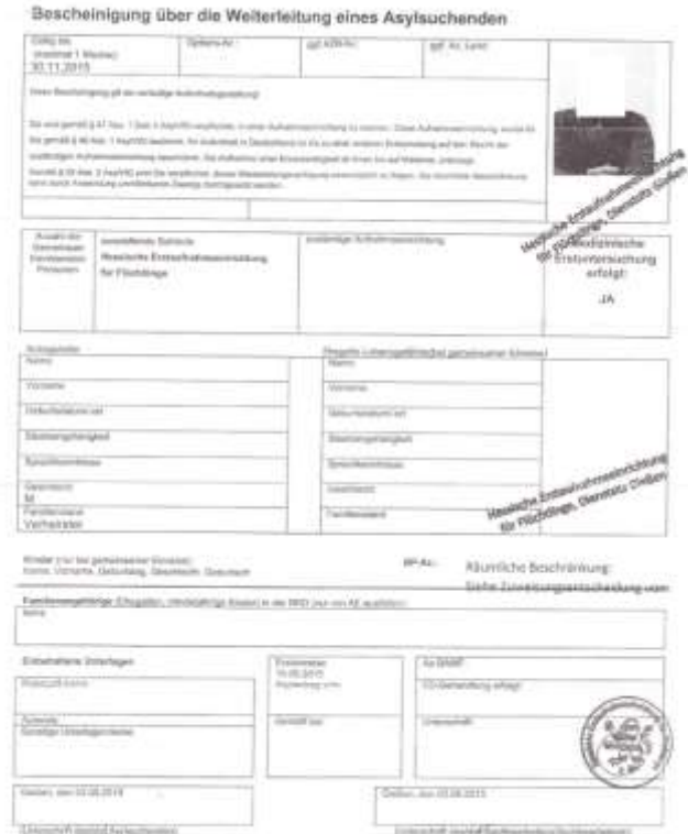
Bescheinigung über Weiterleitung eines Asylsuchenden