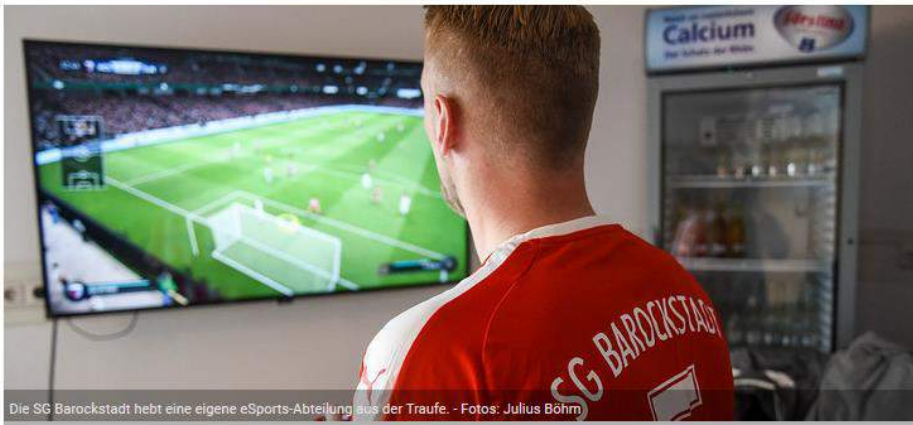
Die SG Barockstadt hebt eine eigene eSports-Abteilung aus der Traufe.