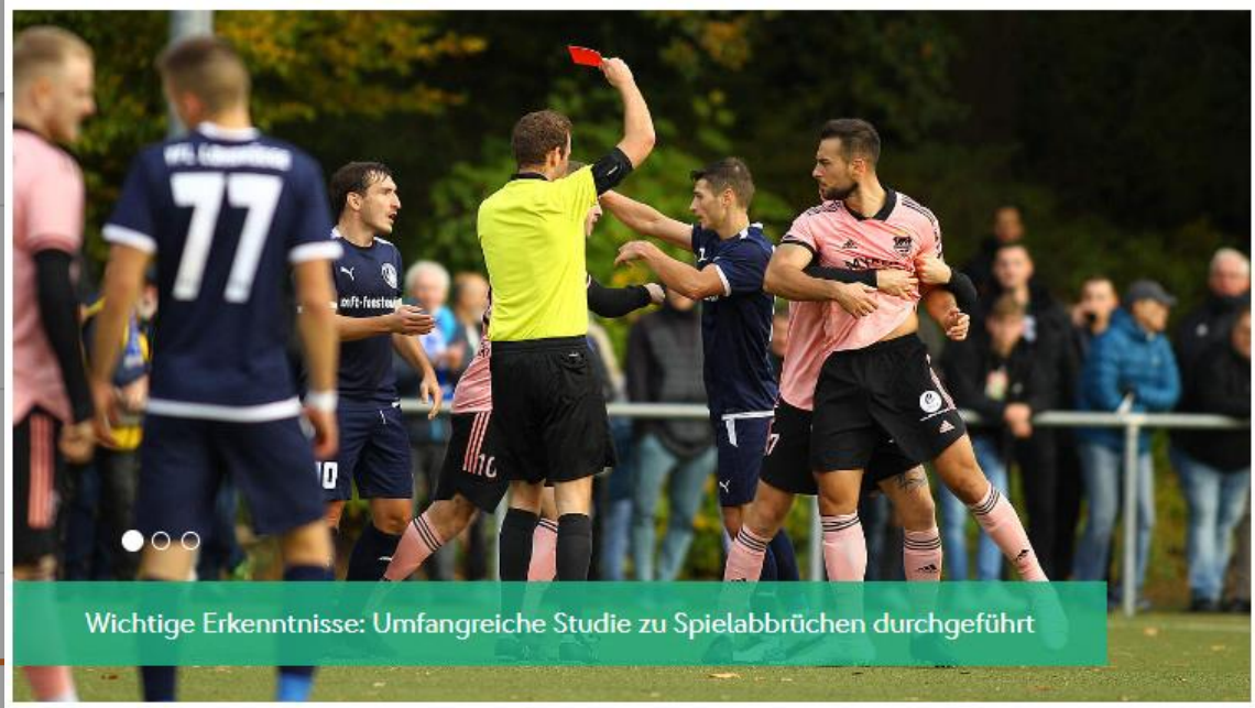
Wichtige Erkenntnisse: Umfangreiche Studie zu Spielabbrüchen durchgeführt